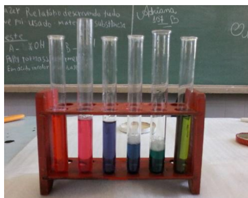
Figura 1- Escala de pH construída

Para a realização da aula a turma foi dividida em dois grupos, pois o laboratório não comporta a turma inteira. O laboratório da escola é antigo, com as bancadas de maneira, poucas vidrarias, não apresenta tubulação de gás e exaustão, porém possui muitos reagentes, o que possibilitou a realização da experiências. Devido a falta de vidrarias não foi possível que cada grupo construísse sua escala de pH, a professora começou a realizar a prática e chamando os alunos para que fossem realizando a experiência, como mostra a Figura 1.